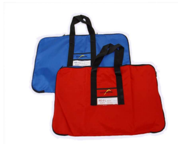
Transporttasche 53,00 EUR